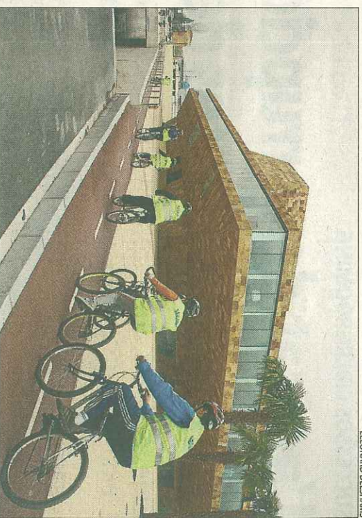
Ciclistes ahir davant de la Llojja, que acull el Congrés de la Bicicleta.

Durant el congrés, es debaten temes vinculats a la mobilitat, i es dedicarà una anàlisi específica a les infraestructures vinculades a la pràctica de la bicicleta, així com a la normativa. El congrés servirà per redactar una Declaració de Lleida, que es presentará avui.