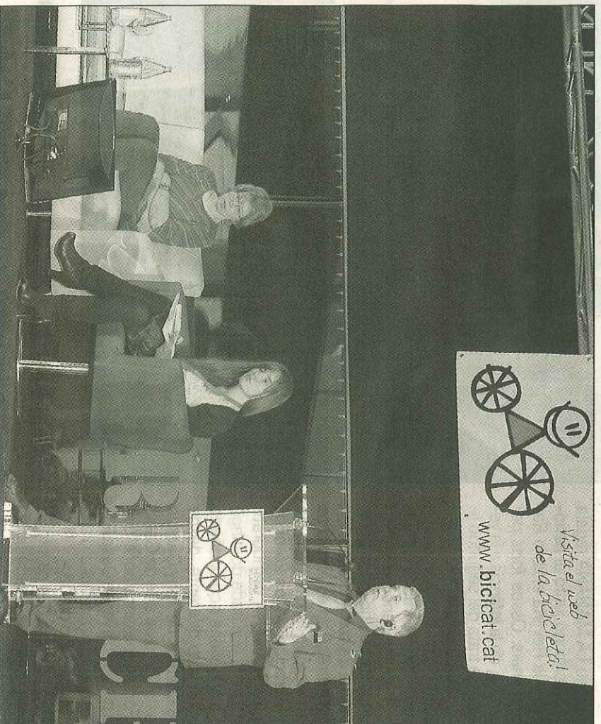
El Palau de Congressos albergará del 14 al 17 de abril el III Congrés de la Bicicleta